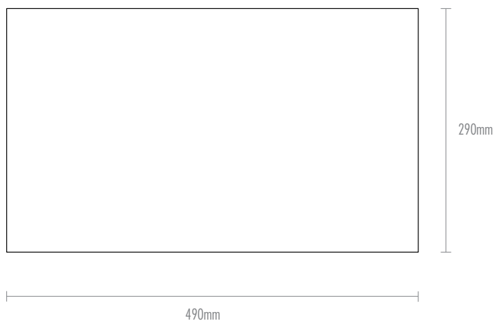
Vista de frente