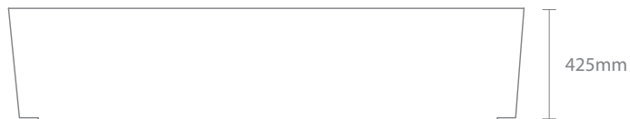
Vista de frente